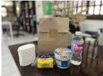
到着時の無料ウェルカムセット