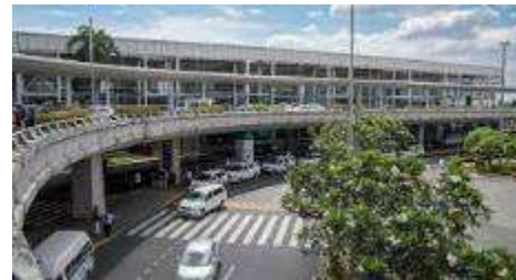
マニラ国際空港（ターミナル2）

コロナ前までもクラーク⇄マニラ北部間は高速道路が開通していたものの、マニラの中心部にあるマニラ国際空港から高速道路路間の渋滞がひどく、マニラ⇄クラーク間は2時間～、渋滞状況によっては4時間かかっていました。その後、2020年に『SKYWAY』という高速道路がマニラ国際空港近くからクラーク間全面開通したことで、現在は安定してマニラ国際空港⇄クラーク間の移動は片道約2時間（最速1時間40分）で可能となっています。