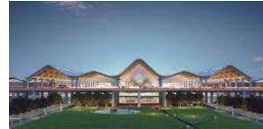
クラーク新国際空港