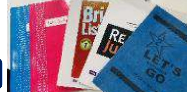
小学生以上の方向け教材一例

当校の親子留学における最大の特徴は、4歳～小学校未就学児の方には毎日のカリキュラムが組まれた幼稚園を自前で保有していることです。同幼稚園では科目ごとに教材・ツールもご用意しており、万一生徒が1人となっても、最低講師とスタッフが計2名以上ついていきますので安心です。小学校～中学3年生のお子様は、講義棟で『JUNIOR ESL COURSE』か欧米ネイティブ講師のマンツーマン授業2コマとグループ授業1コマを含む『JUNIOR ESL NATIVE COURSE』の何れかのコースで学んで頂きます。勿論、教材は幼稚園用・小学生以上用(中学卒業まで)に分かれており、それぞれ豊富にご用意しております。