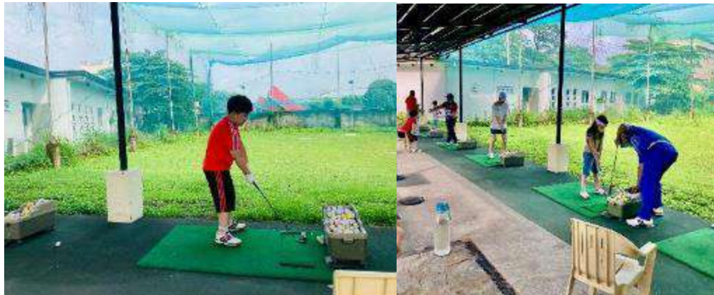
WE ACADEMYキャンパス内のゴルフ練習場