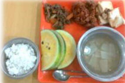
野菜スープ、豆腐、肉野菜炒め、 チキン、ライス、スイカ