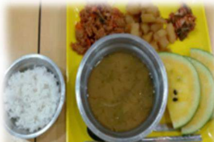
肉味噌炒め、酢の物、味噌汁、 ライス、スイカ