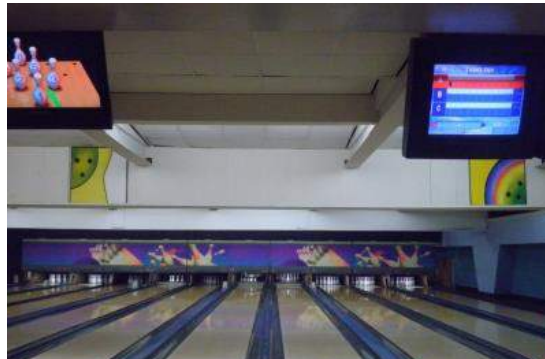
クラスメイトとボーリング