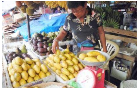
ローカルマーケットめぐり