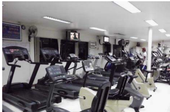
LSLC付近には複数のジムが有！