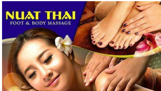
格安マッサージで癒される