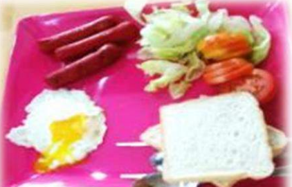
レタスとトマトのサラダ、ウインナー 目玉焼き、ピーナツバタートースト