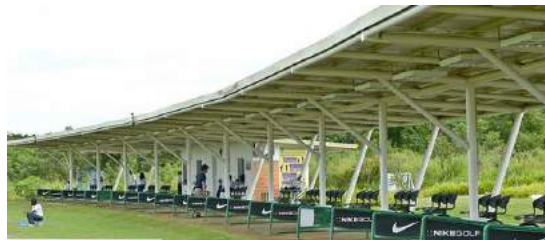
LSLCから車で10分のゴルフ練習場