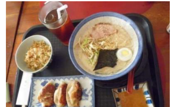
日本食レストラン