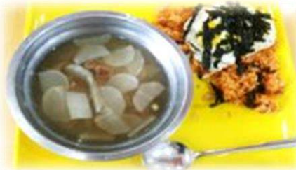
目玉焼きのせチャーハン、 具だくさんスープ