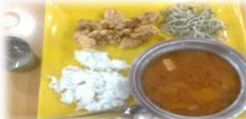
フライドチキン、もやし炒め、 味噌汁、ライス