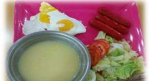
レタスとトマトのサラダ、ウインナー、 目玉焼き、コーンスープ、ライス