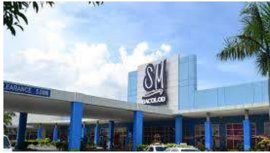
大型モールでショッピング