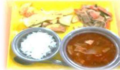
野菜炒め、具だくさんスープ、 スイートポテト、ライス