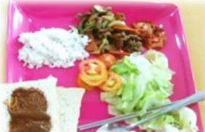
レタスとトマトのサラダ、肉野菜炒め、ライス、ピーナツバタートースト