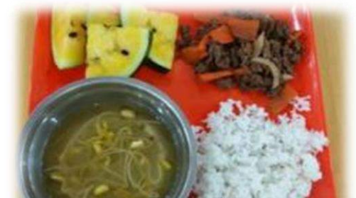
肉野菜炒め、もやしスープ、 ライス、スイカ