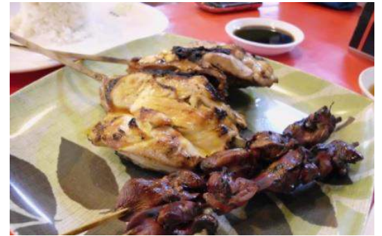
フィリピン料理レストラン