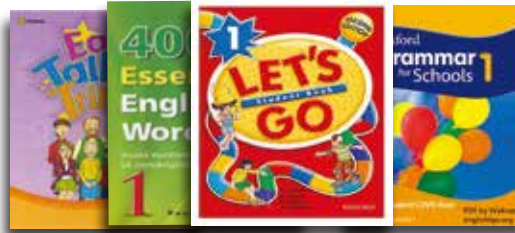
Junior ESL Book