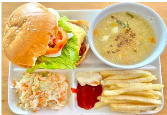
エビバーガー、フライドポテト、 コールスローサラダ、コーンスープ