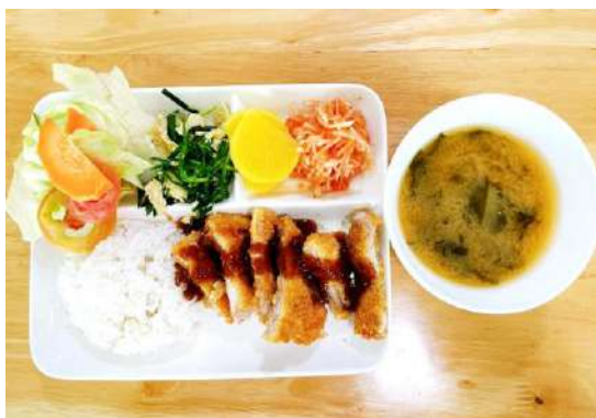
トンカツ、みそ汁、大根のキムチ和え、 ニラと油揚げの炒め物、サラダ

English Fella では 土日祝含め 1日3食 、カフェテリアで食事を召し上がっていただけます。日本料理、韓国料理、フィリピン料理、そして中華を組み合わせた献立を準備しています。朝食はトーストとフルーツ、シリアルといった洋食です。また、フィリピンでは摂取しにくい生野菜もたっぷり食べられると好評です。