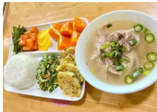
サムゲタンスープ、キュウリの炒め物、 チヂミ、カクテキ、ニラの和え物