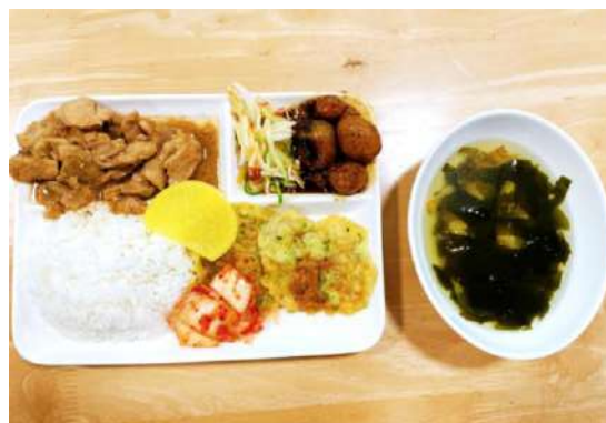
豚の生姜焼き、わかめスープ、 チヂミ、キュウリとリンゴの酢の物