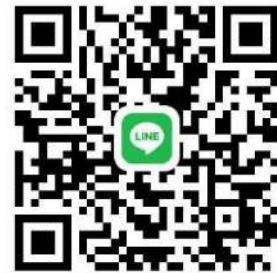
EV PICK-UP LINE QR- CODE